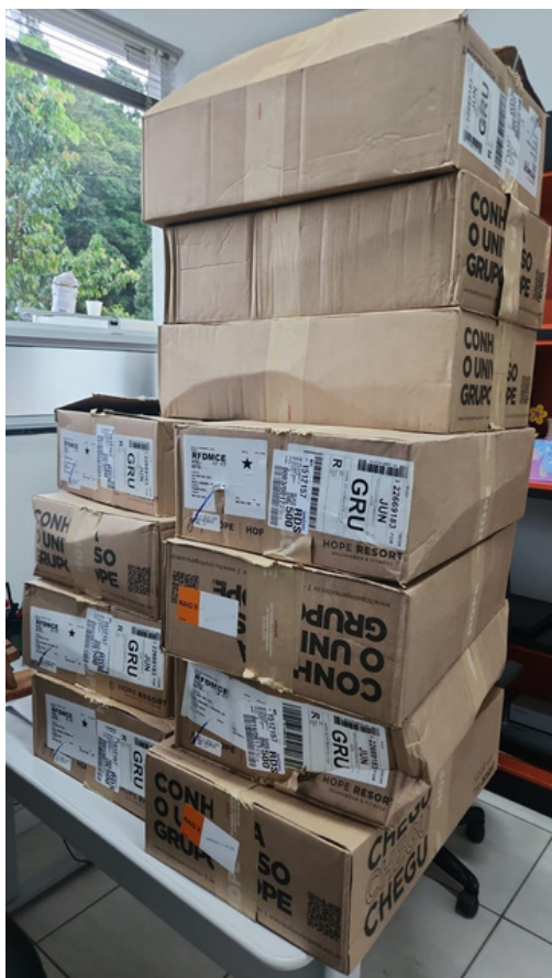
Recebimento de doações de roupas novas