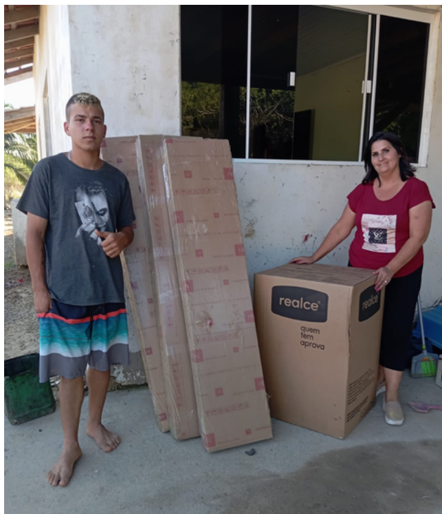
Entregas de Armários e Fogões