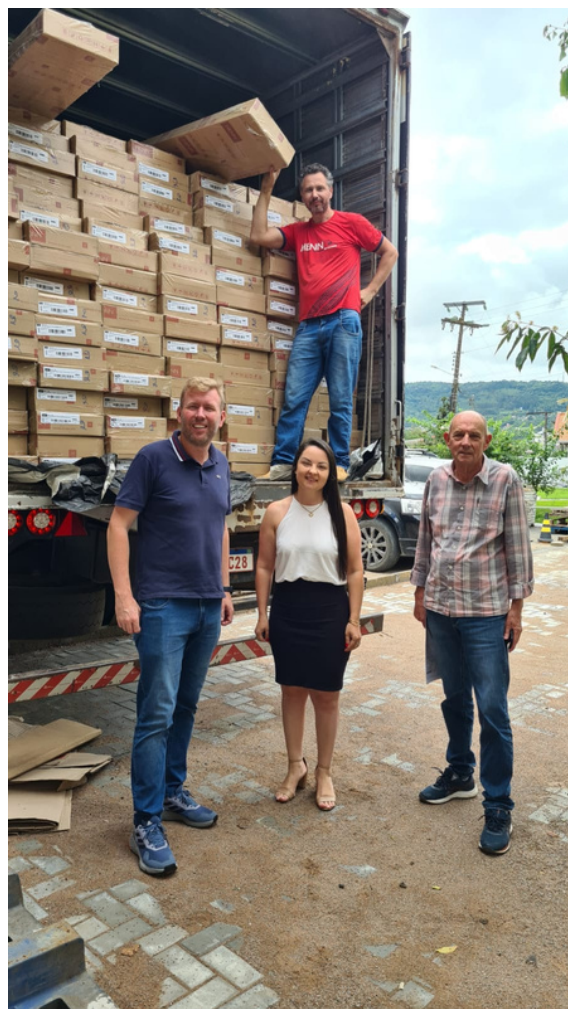
Recebimento dos 320 Armários