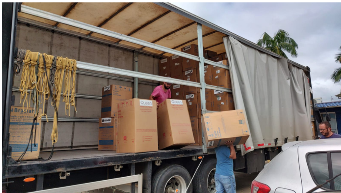
Recebimento dos 250 Fogões - Doação Hyundai Brasil