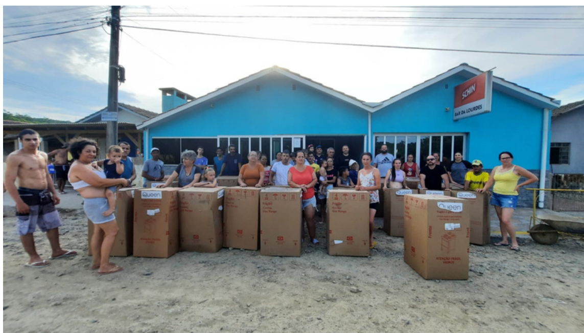
Entrega dos Fogões na Cohab Bela Aliança